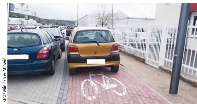
Samochód parkujący na ścieżce rowerowej