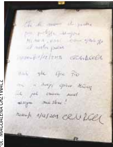
Fot. MAGDALENA GRZYWACZ

- To będzie trudny rok. Przygotowaliśmy projekt budżetu, który aktualnie jest analizowany przez Radnych Miasta Mława. Będę prosił, aby 17 grudnia został przyjęty do realizacji na kolejny rok. Wydatki z budżetu będą ponosić Burmistrz Miasta Mława, dyrektorzy mławskich jednostek oraz naczelnicy wydziałów. Zawsze przygotowujemy budżet gospodarnie – bardzo rozsąd-