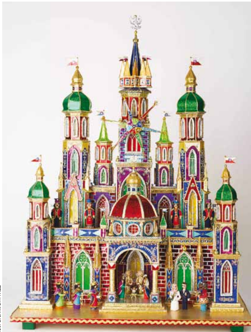
fol. archiwum MZZ

Zostały one zaprezentowane w różnych kontekstach: od tych najstarszych po te całkiem nowe. Szopki jako sceny Bożego Narodzenia czy wyimki z życia Krakowa; jako świadectwa rodzinnych tradycji oraz międzypokoleniowego przekazu wiedzy i umiejętności. Szopki jako polityczne komentarze oraz antidotum na chorobę i samotność, jako dzieła nie tylko ludzkich rąk, ale przede wszystkim serca.