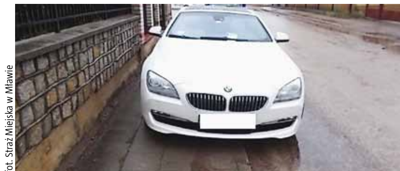
Auto uniemożliwiające przejście pieszym

Na terenie Mławy dużym problemem jest niezgodne z przepisami ruchu drogowego parkowanie samochodów. Strażnicy miejski i policjanci wielokrotnie spotykają podczas swoich patroli pojazdy stojące w miejscach niedozwolonych – w tym poza obszarami wyznaczonymi do tego w strefach zamieszkania i na wąskich chodnikach. Takie praktyki powodują utrudnienia dla innych uczestników ruchu i mogą skutkować mandatem.