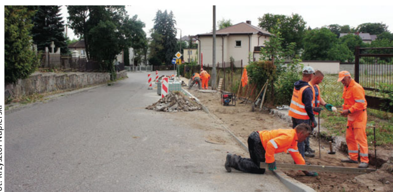
Prace przy przebudowie chodnika w ul. Nowowiejskiej

T rzeci z pięciu planowanych budynków przy ul. Komunalnej, które wzbogacą i odświeżą bazę lokalową miasta, odebrano 24 września br. Na całkowitej powierzchni 499,28 m kw. (kubatura: 1 087,43 m sześć.) mieści się 12 mieszkań. Lokale są wykończone, przystosowane do tego, aby się do nich wprowadzać. Łączny koszt inwestycji wyniósł 1 268 000,69 zł. Prace nad wzniesieniem czwartego budynku już się rozpoczęły. Docelowo w tym rejonie będzie ich pięć. – Pracujemy nad przydziałami dwunastu nowo powstałych mieszkań i liczymy, że jeszcze tej jesieni burmistrz Sławomir Kowalewski wręczy lokatorom klucze – mówi Piotr Tomaszewski, naczelnik Wydziału Gospo-