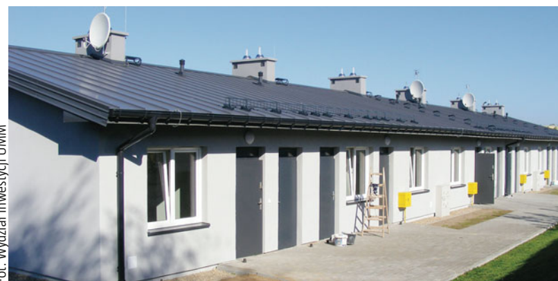
Trzeci budynek przy ul. Komunalnej już został odebrany

m) kosztował 207 566,81 zł. Przebudowie poddano także chodniki: w ul. Jana Matejki (odcinek od ul. Bednarskiej do ul. Olsztyńskiej, długość: ok. 90 m, koszt: 46 705,73 zł) oraz – za 169 288,02 zł – w ul. Olsztyńskiej: od ul. Marii Konopnickiej do ul. Torfa Załęskiego, po prawej stronie (długość: ok. 250 m) i od ul. Jana Matejki