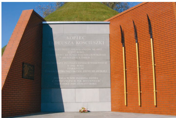
Kopiec Tadeusza Kościuszki znajduje się przy ul. Kościelnej na Wólce

Insurekcja kościuszkowska była zdecydowanym wyrazem sprzeciwu wobec polityki Rosjan, dwóm rozbiorom dokonanym przez sąsiadów oraz zrywem przeciwko kolaborującej z Rosją Targowicy. Za oficjalną datę jej rozpoczęcia uznaje się dzień 24 marca 1794 roku, kiedy to Najwyższy Naczelnik Siły Zbrojnej Narodowej Tadeusz Kościuszko złożył w Krakowie ślubowanie.