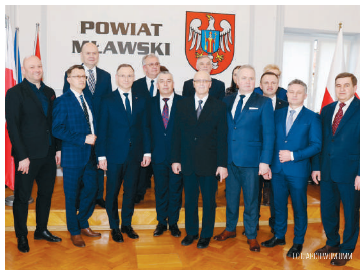
Prezydent spotkał się w budynku starostwa z mławskimi samorządowcami.

Zapewnił, że głęboko ufa, że Polska będzie bezpieczna i nadal będzie rozwijała się, jeżeli będziemy konsekwentnie realizowali politykę umacniania kra-