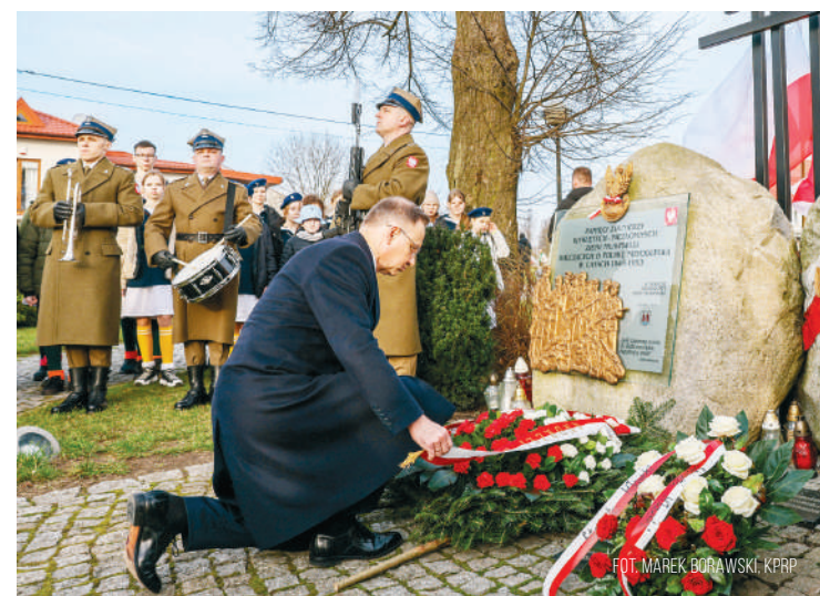
Wizyta prezydenta w Mławie rozpoczęła się od złożenia wieńca pod pomnikiem Żołnierzy Wyklętych

Była to trzecia w historii wizyta urzędującego Prezydenta Rzeczypospolitej Polskiej w Mławie, po Ignacym Mościckim (26 maja 1930 r.) i Bronisławie Komorowskim (31 sierpnia 2013 r.). Przypomnijmy, że Mławę odwiedzali dotychczas także Lech Wałęsa (po