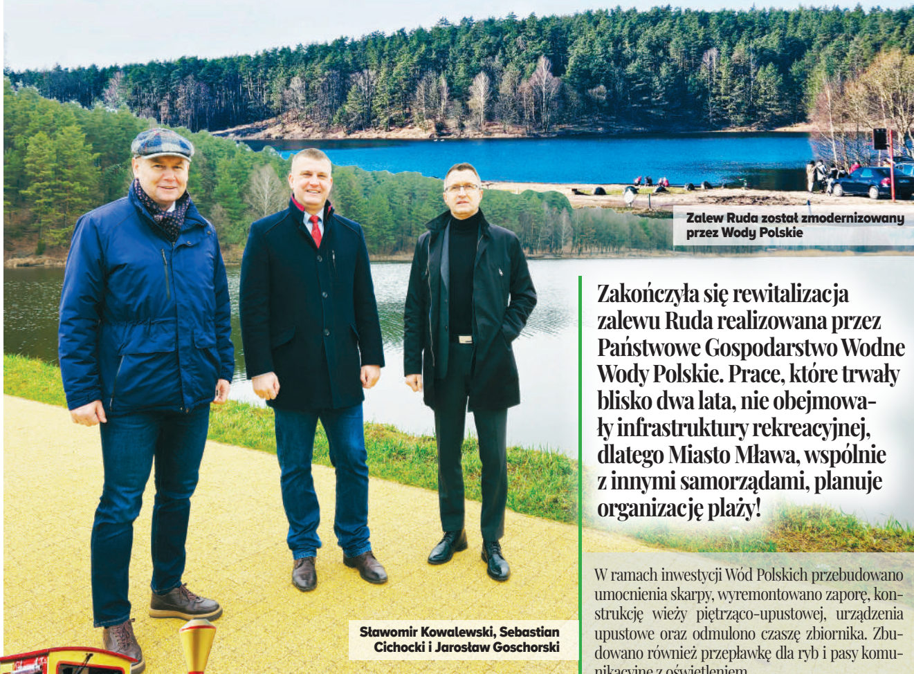
Zalew Ruda został zmodernizowany przez Wody Polskie