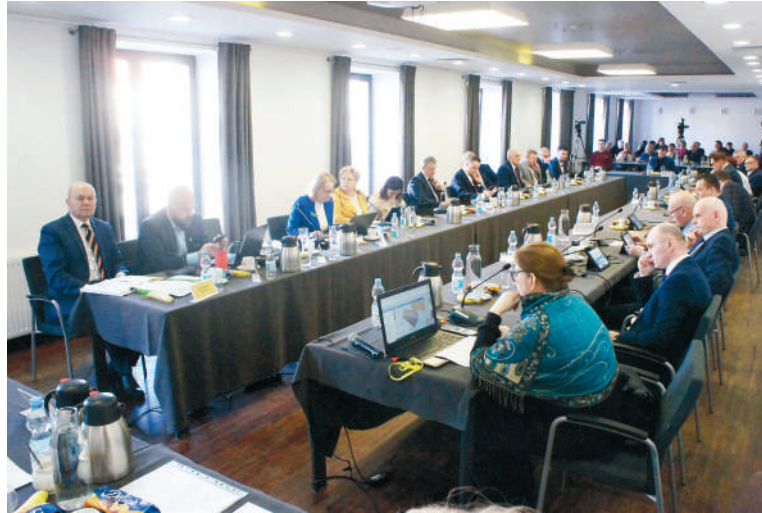
Plan „Zuzanny Morawskiej” i „Osiedle Młodych” część II zostały przyjęte podczas sesji rady miasta 26 lutego

Miejscowy plan zagospodarowania przestrzennego „Osiedle Młodych” część II dotyczy obszaru w środkowej części Mławy, między ul. dr Michała Łojewskiego, Anny Dobrskiej i terenem szpitala (0,63 ha). Jest on konsekwencją uwzględnionej częściowo przez Burmistrza Miasta Mława uwagi do planu dla całego Osiedla Młodych, wyłożonego dla mieszkańców do wglądu w maju i czerwcu 2022 r. Obszar, którego dotyczyła uwaga, został wyodrębniony i kontynu-