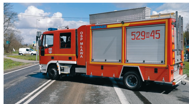
Nowy samochód zastąpi ponaddwudziestoletnie, wystuzone iveco (na zdej.)

W ogłoszonym przez OSP postępowaniu na zakup samochodu ofertę złożyła firma Szczęśniak Pojazdy Specjalne Sp. z o.o. z Bielska-Białej. Jednostka kupi od niej pojazd o mocy silnika 210 kW i pojemności zbiornika na wodę 3055 litrów, z manualną skrzynią biegów, za 1 089 903 zł. Będzie to samochód kategorii miej-