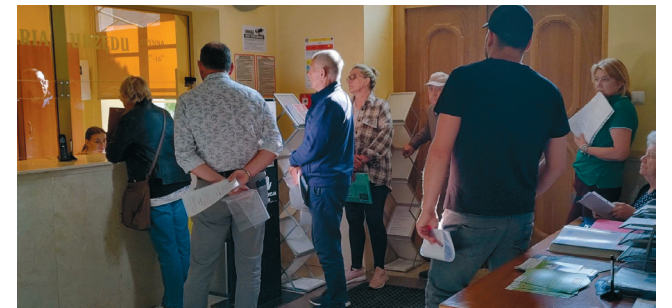
1 czerwca wnioski złożyło 14 osób

Od 1 czerwca w Urzędzie Miasta Mława są przyjmowane wnioski o dotację na wymianę źródeł ciepła w ramach ograniczenia niskiej emisji na terenie miasta. Na ten cel, w tym roku, podobnie jak w latach ubiegłych, władze miasta przeznaczyły 200 tys. zł.