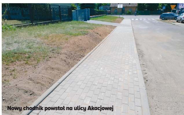
Nowy chodnik powstał na ulicy Akacjowej