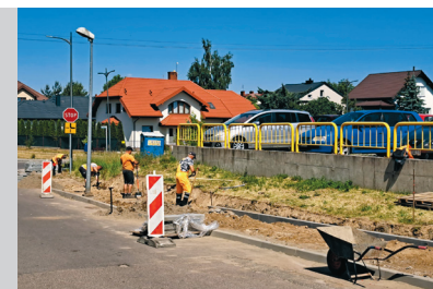
Zwiększamy bezpieczeństwo mieszkańców i budujemy kolejne chodniki