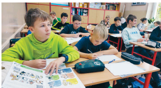
Warsztaty odbyły się w 6 szkołach

Szkoły podstawowe nr 2 i nr 6 były ostatnimi placówkami, w których przeprowadziliśmy komiksowo-plastyczne warsztaty o tematyce ekologicznej.