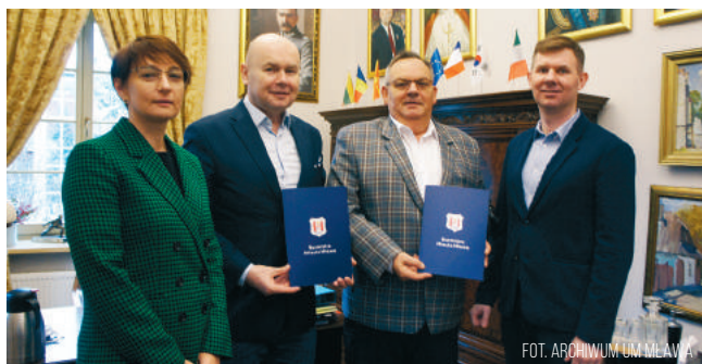
Władze miasta z przedstawicielami firmy KRUSZ-BET PLUS

Rozpoczęto przebudowę ulicy Powstańców Wielkopolskich w Mławie, realizowaną w ramach zadania pod nazwą: „Budowa i przebudowa dróg na terenie Miasta Mława”.