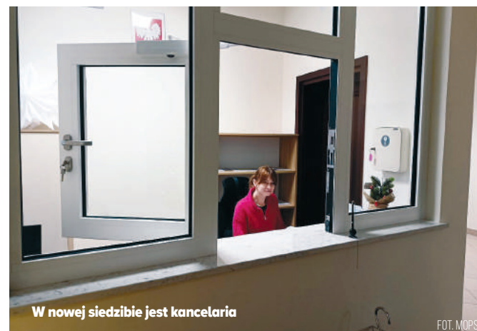
W nowej siedzibie jest kancelaria

– MOPS od kilku lat realizuje różnego rodzaju działania i projekty skierowane do mieszkańców miasta Mława. Już w 2010 r. otrzymał certyfikat Centrum Aktywności Lokalnej, co było