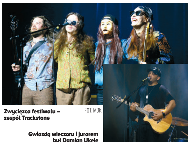
Zwycięzca festiwalu – zespół Trackstone

Za nami XIX Ogólnopolski Festiwal Muzyki Młodzieżowej Rockowania. Wydarzenie odbyło się 2 grudnia w Miejskim Domu Kultury w ramach działań profilaktycznych prowadzonych przez Miasto Mława.