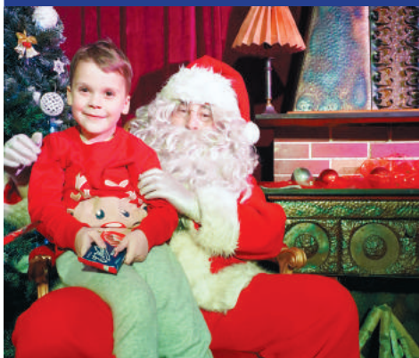
FOT. UMM, MDK