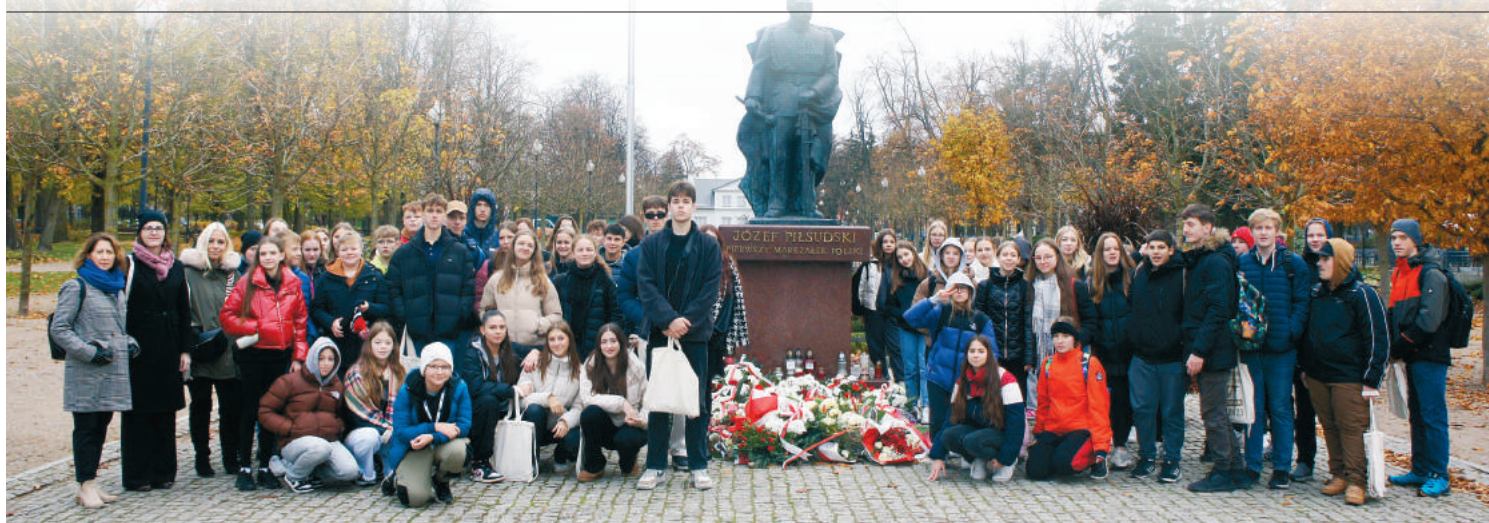
Goście z Niemiec zwiedzili Mławę i okolice

W RAMACH PROJEKTU ERASMUS+ SZKOŁA PODSTAWOWA NR 6 W MŁAWIE GOŚCIŁA MŁODZIEŻ Z DWÓCH SZKÓŁ NIEMIECKICH. WIZYTA BYŁA DLA GOŚCI DOSKONAŁĄ OKAZJĄ DO POZNANIA MIASTA, HISTORII I KULTURY REGIONU ORAZ POLSKI, WYMIANY DOŚWIADCZEŃ ORAZ DOBREJ ZABAWY I NAWIĄZYWANIA NOWYCH PRZYJAŹNI.